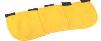
Empiècement cache-oreilles en PBI/Kevlar