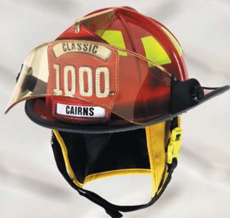
Casque Classic 1000 MC

Choisissez Cairns : des millions de pompiers ont fait ce choix depuis des générations!