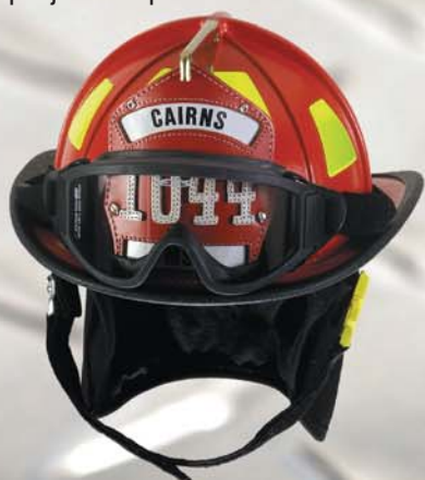
Casque 1044 MC de Cairns

Protection équilibrée d'allure classique