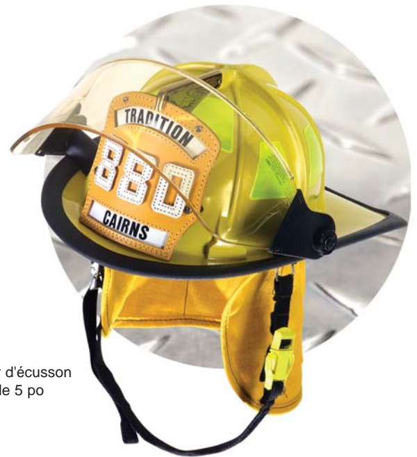
Hauteur d'écusson frontal de 5 po