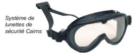
Système de lunettes de sécurité Cairns