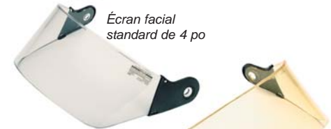
Écran facial standard de 4 po