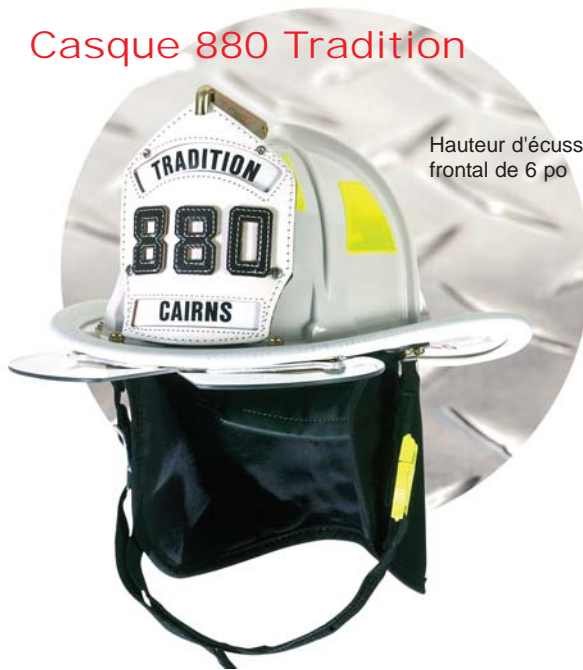
Hauteur d'écusson frontal de 6 po