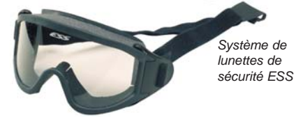
Système de lunettes de sécurité ESS