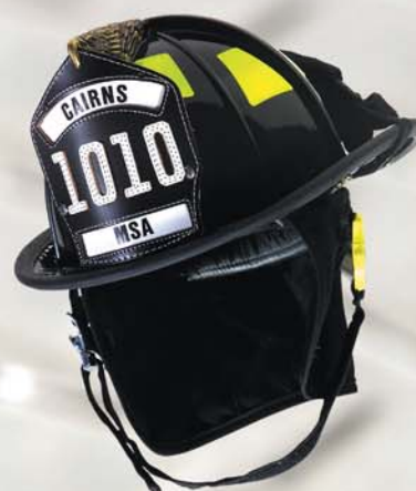
Casque 1010 MC de Cairns

Protection anti-projectiles pour des conditions extrêmes