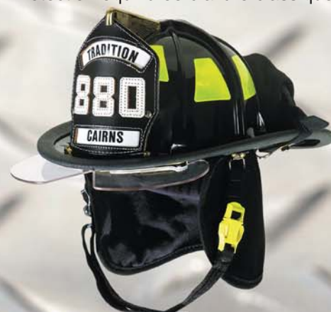
Casque 880 MC Tradition

Construction robuste, résistance quotidienne à toutes épreuves